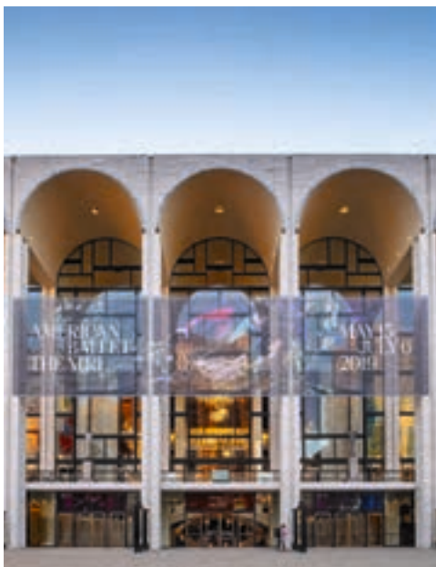
MET Opera

Potager du Dauphin Cycle 17 de quatre conférences: TP 23,20 € | TR 8 €