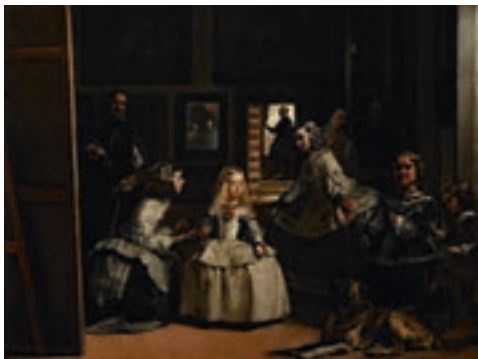
Les Ménines , Diego Velázquez