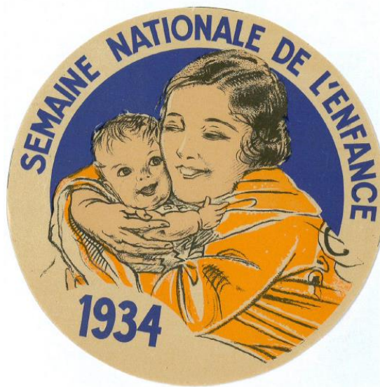
Figure 1: Semaine nationale de l'enfance 1934 (5Q3).

Réalisé par Alix de Dreuille, archiviste aux archives municipales de Meudon sous la direction de Stéphanie Le Toux, attachée de conservation du patrimoine