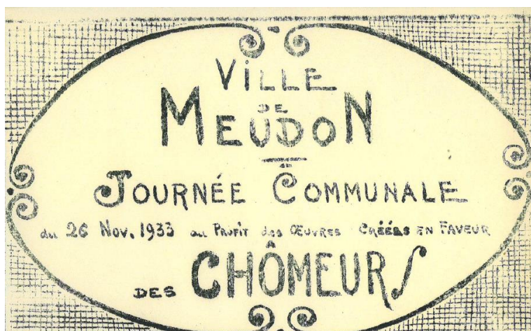
Figure 4 : Journée des chômeurs 1933, 5Q12

Pendant la Première Guerre mondiale, 331 meudonnais étaient au chômage. Un registre a été mis en place à Meudon dans le but d'allouer des secours aux chômeurs. Le 3 mai 1919, on comptabilisait 79 chômeurs meudonnais et 404 chômeuses meudonnaises.