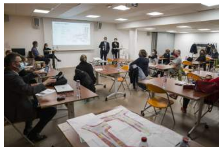
La séance plénière de « reprise », le 7 octobre 2020