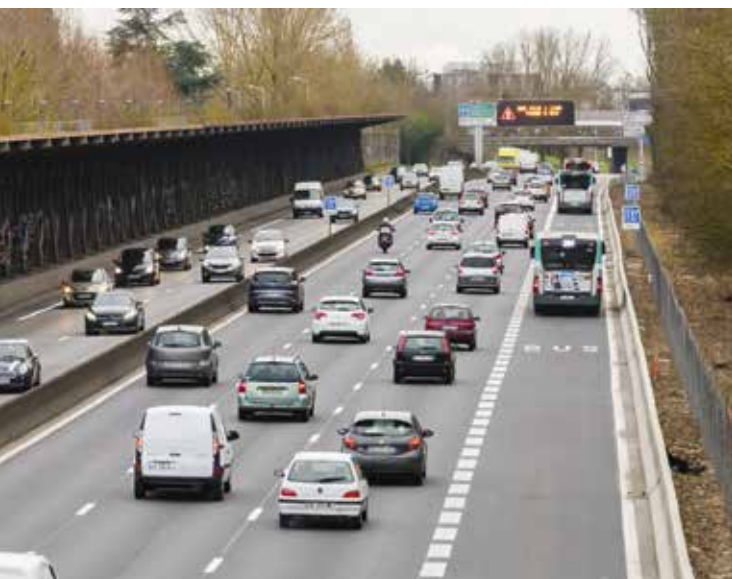
► Voie dédiée sur la N118 dans le sens Paris > Vélizy-Villacoublay

En cas de nécessité absolue, les usagers en détresse peuvent s'arrêter en urgence sur la voie dédiée.