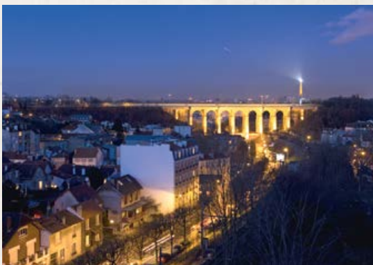
La Tour Eiffel, phare de Meudon !

Après avoir habité Levallois-Perret, Gustave Eiffel, veuf depuis 1877, s'installa à Sèvres en 1890 avec ses cinq enfants dans une vaste propriété, voisine de la propriété de Bussières. Après la Grande Guerre, la famille Eiffel attribuait aux meilleurs élèves des