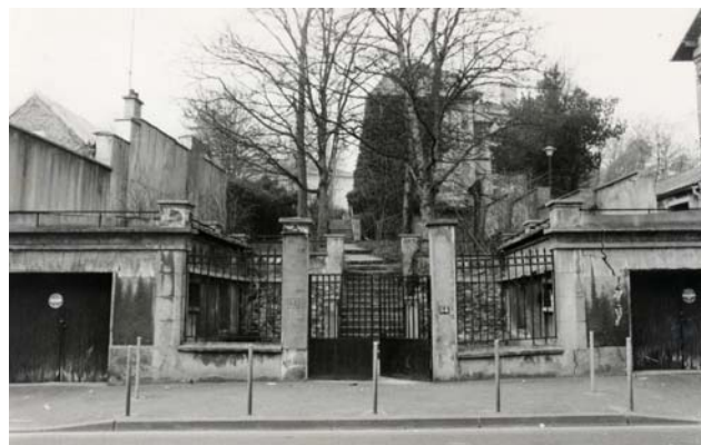
4Fi4496 : Photographie du 82 rue de la République avant la réhabilitation de Trivaux-République en 1988.

En 1737, 3 sœurs s'occupaient de l'école de filles. Il s'agissait de Jeanne Pomier, Agnès Azelard et Servanne Le Cerf.